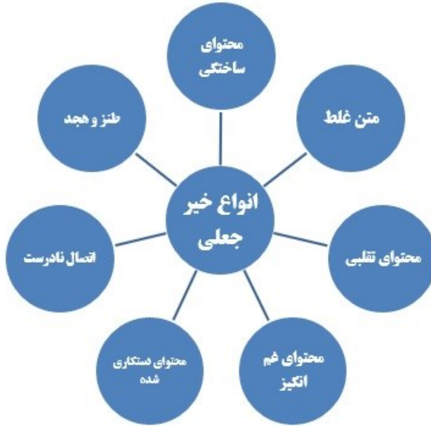
شکل(۱): انواع خبر جعلی از دیدگاه واردن

گسترده‌گی و تنوع زیادی در اخبار جعلی وجود دارد که شدت و قالب‌های متفاوتی برای جلب توجه مخاطب دارد. واردن ۱ که مدیر تحقیقات «پیش نویس اولین خبر ۲ معتقد است که می‌توان اخبار جعلی را بر اساس الگوها، تأثیر و قالب آنها در هفت دسته طبقه بندی کرد که در شکل ۱ ارائه شده است