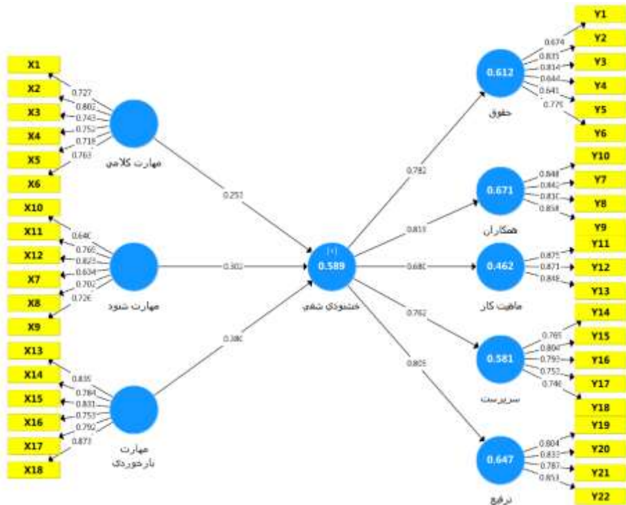
شکل (۱): مدل پژوهش با ضرایب استاندارد شده (فرضیات فرعی)

همانطور که در جدول فوق ملاحظه می شود، مقدار GOF مدل قابل قبول و برابر ۰,۴۲۴ محاسبه شده است. همچنین مقدار ضریب تعیین خشنودی شغلی (۰,۵۸۹) نشان می دهد که مولفه های مهارت های ارتباطی با همکاری یکدیگر و در مجموع توانسته اند ۵۸,۹ درصد از تغییرات خشنودی شغلی را پیش بینی نمایند. مقدار VIF برای متغیرهای مستقل کمتر از حد مرزی ۵ برآورد شده که نشان می دهد هیچ مشکل هم خطی بین داده ها مشاهده نشده است. در حقیقت نتایج شاخص VIF فوق حکایت از نبود مشکل هم خطی دارد.