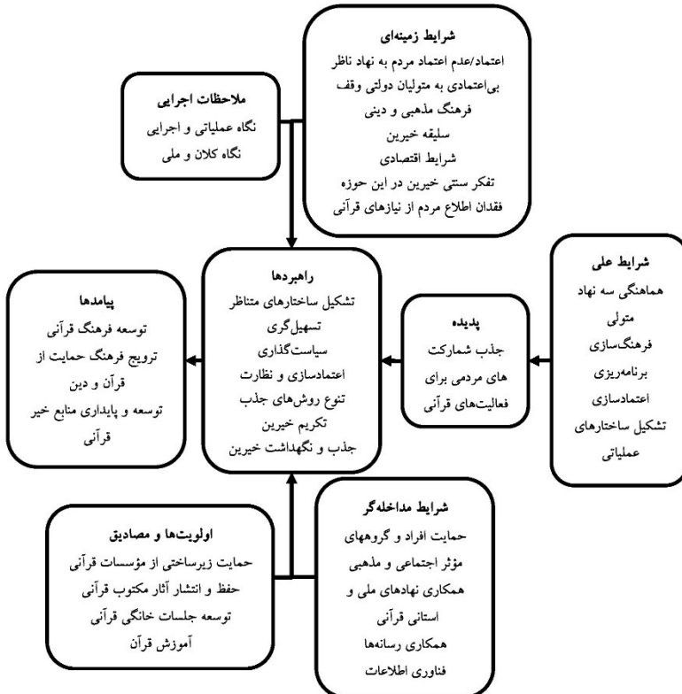
شکل (۳): الگوی جذب مشارکت های مردمی در فعالیت های قرآنی (سیدی، ۱۴۰۲)

در این راستا سیدی (۱۴۰۲) در مطالعه خود با روش تحقیق کیفی نظریه داده بنیاد با رویکرد نظام مند اشتراوس و کوربین برای بررسی موضوع جذب مشارکت استفاده شده است. مبنای مدل جذب مشارکت های مردمی برای فعالیت های قرآنی تسهیل گری نهادهای متولی از طریق راه اندازی ساختار جذب مشارکت مردمی در سازمان ها و همکاری با مجمع ملی خیرین قرآنی و واحد جذب مشارکت در مؤسسات قرآنی است. این ساختار همکارانه با اجرای راهبردهای شناسایی شده بر پایه شناخت اولویت ها و نیازها در مسیر دستیابی به هدف توسعه منابع پایدار برای فعالیت های قرآنی قرار می گیرد.